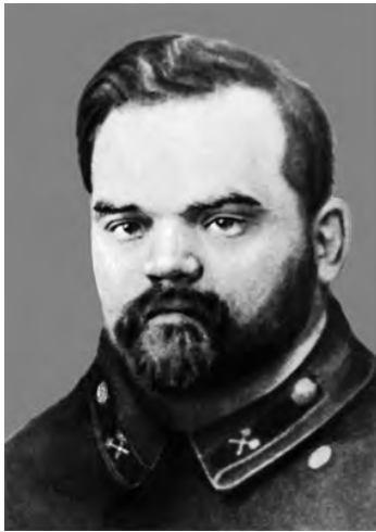
Ф. Ф. Сыромолотов

должности почти четверть века. Теперь он считается основателем Уральской школы минералогии и петрографии, а также одним из создателей Уральского геологического музея.